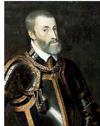
Karl V. (Tizian)